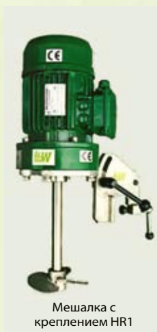
Мешалка с креплением HR1

Зажимные крепления HR1 и HR2. Эти очень прочные и простые в эксплуатации приспособления позволяют обеспечивать надежное винтовое крепление мешалок к краям емкостей.