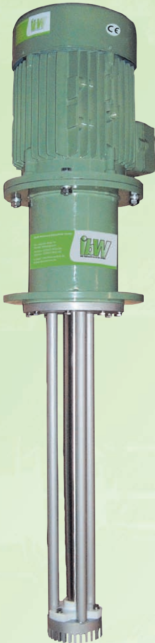
Машина для прерывистого диспергирования UniRex® URC с парой ротор-статор, крепящейся посредством направляющих колонках.